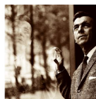
Αριστερά, «Αντίλογος», λάδι σε καμβά φιλοτεχνημένο το 1962, ένα από τα 120 έργα από τη Συλλογή του Γιάννη Σπυρόπουλου (επάνω) που παρουσιάζονται από σήμερα στο Μουσείο Μπενάκη