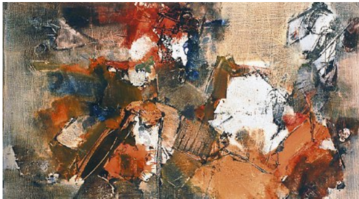
«Αντίλογος» (1962, λάδι σε καμβά)

Ο ίδιος δεν μιλούσε εύκολα για τη δουλειά του: «Εγώ ζωγραφίζω, δεν εξηγώ», έλεγε. Κι όταν το καλλιτεχνικό κατεστημένο του έβαλε εμπόδια, προσπαθώντας να τον περιθωριοποιήσει, εκείνος διάλεξε τη σιωπή.