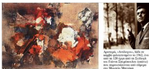
Αριστερά, «Αντίλογος», λάδι σε καμβά φιλοτεχνημένο το 1962, ένα από τα 120 έργα από τη Συλλογή του Γιάννη Σπυρόπουλου (επάνω) που παρουσιάζονται από σήμερα στο Μουσείο Μπενάκη